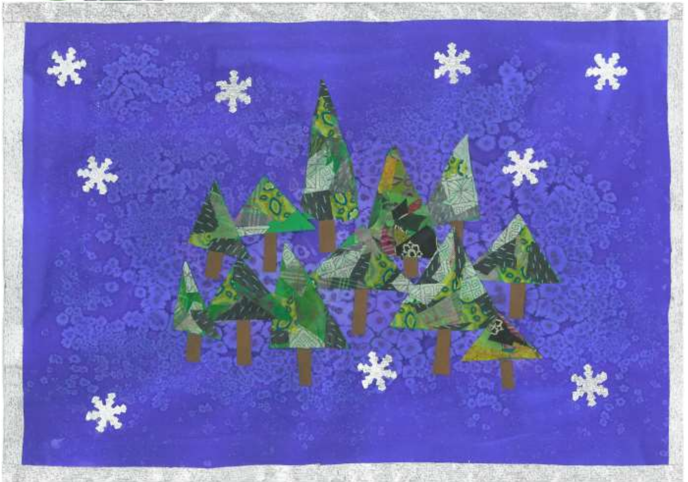
Dessin de l'école maternelle de St-Georges-d'Aurac.