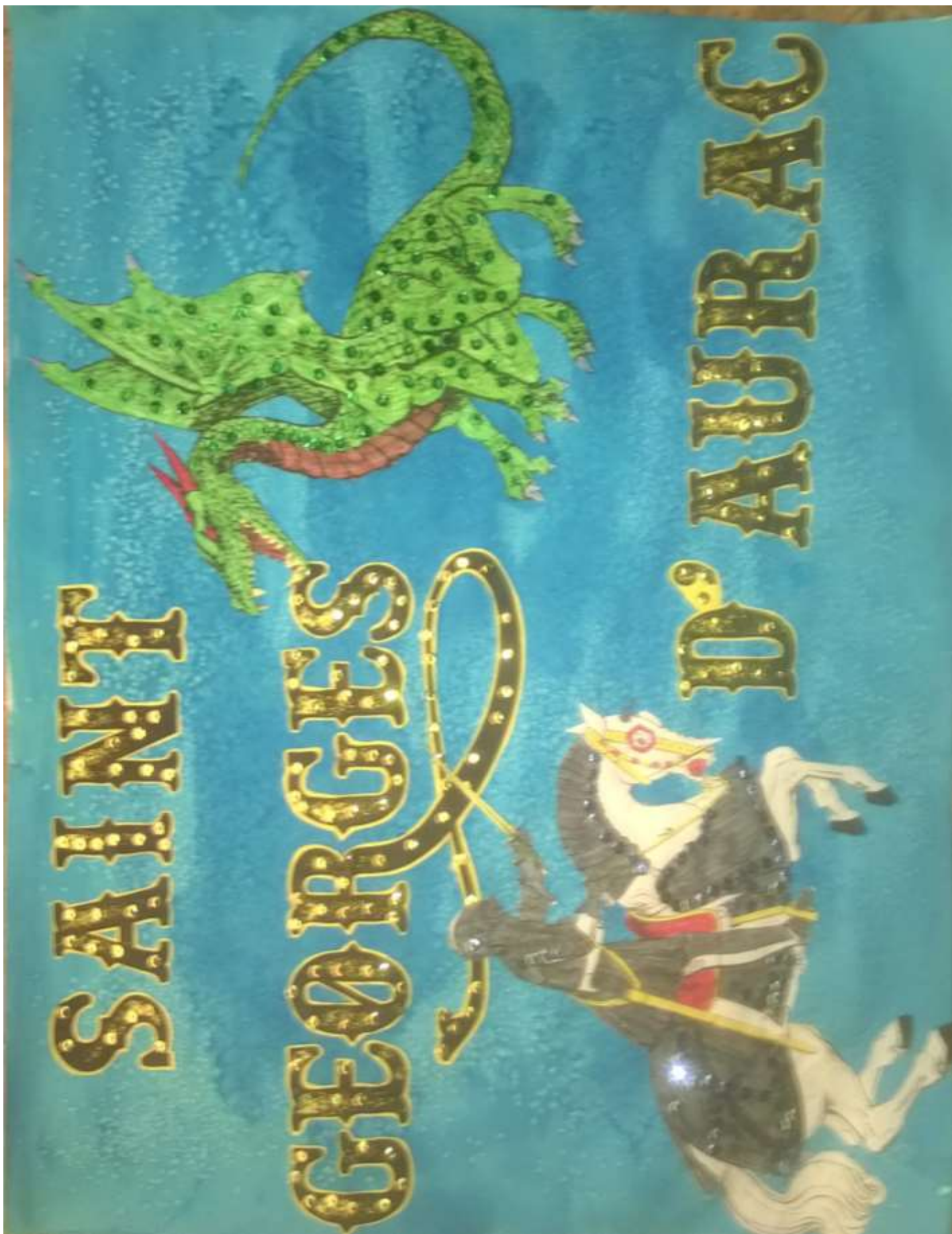
Dessin de l'école élémentaire de Saint-Georges-d'Aurac